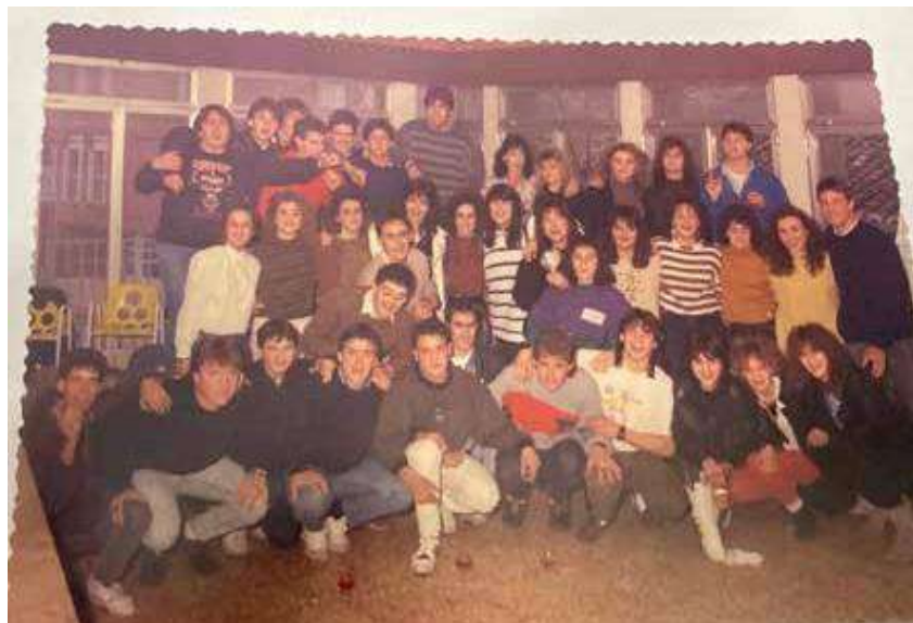
Quintos de 1971