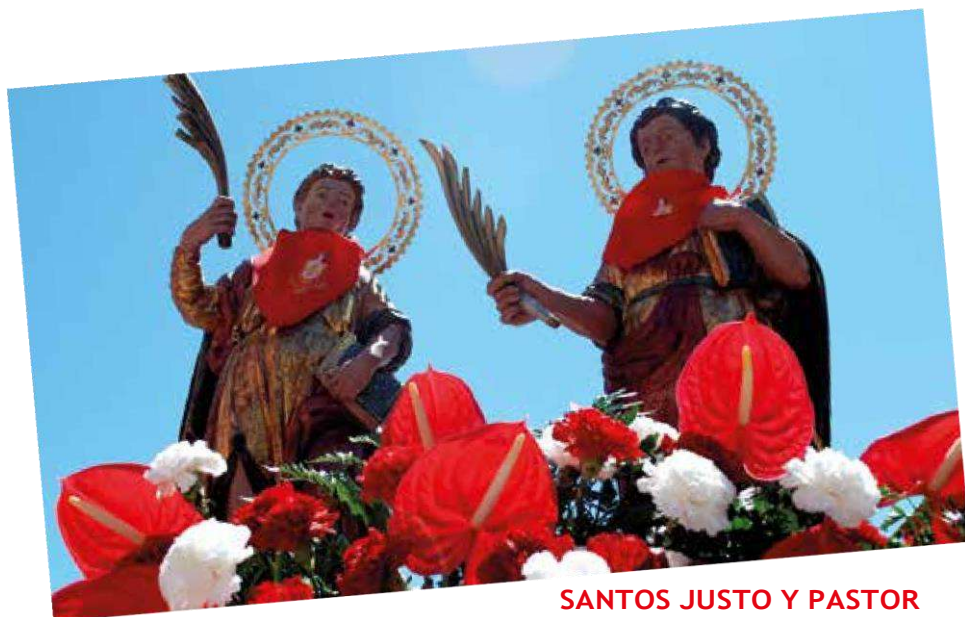
SANTOS JUSTO Y PASTOR