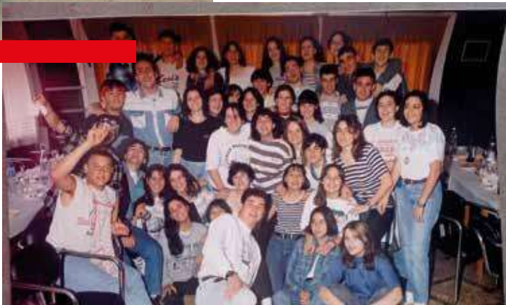
Quintos de 1977