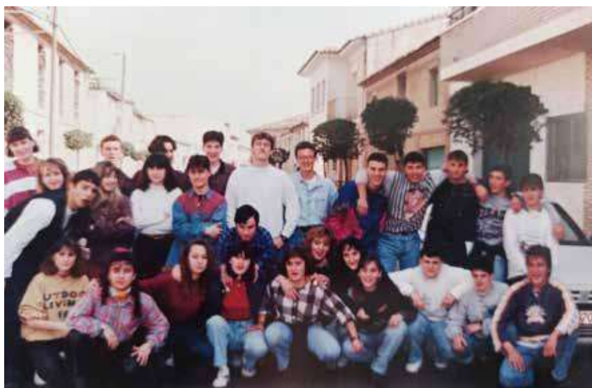
Quintos de 1975