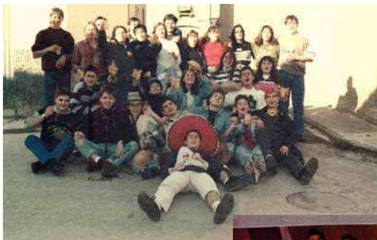
Quintos de 1976

Y para terminar, concentración de las CUATRO quintas en la carpa, hasta que el cuerpo aguante.